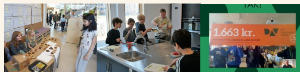
Projekt 4. klasse

Vi fulgte 0.-3. klasse dagen før påskeferien, 8. april, hvor de var påske-tema at spore flere steder (link)