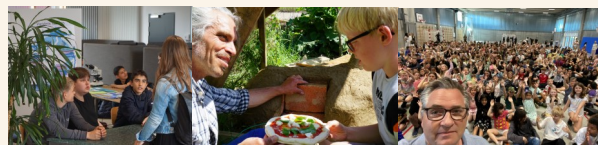
Vandprojekt 7. klasse

Peers er et nyt netværk som står for Peer to Peer læring, altså at man lærer af hinanden uanset om man er lærer eller elev ( link )